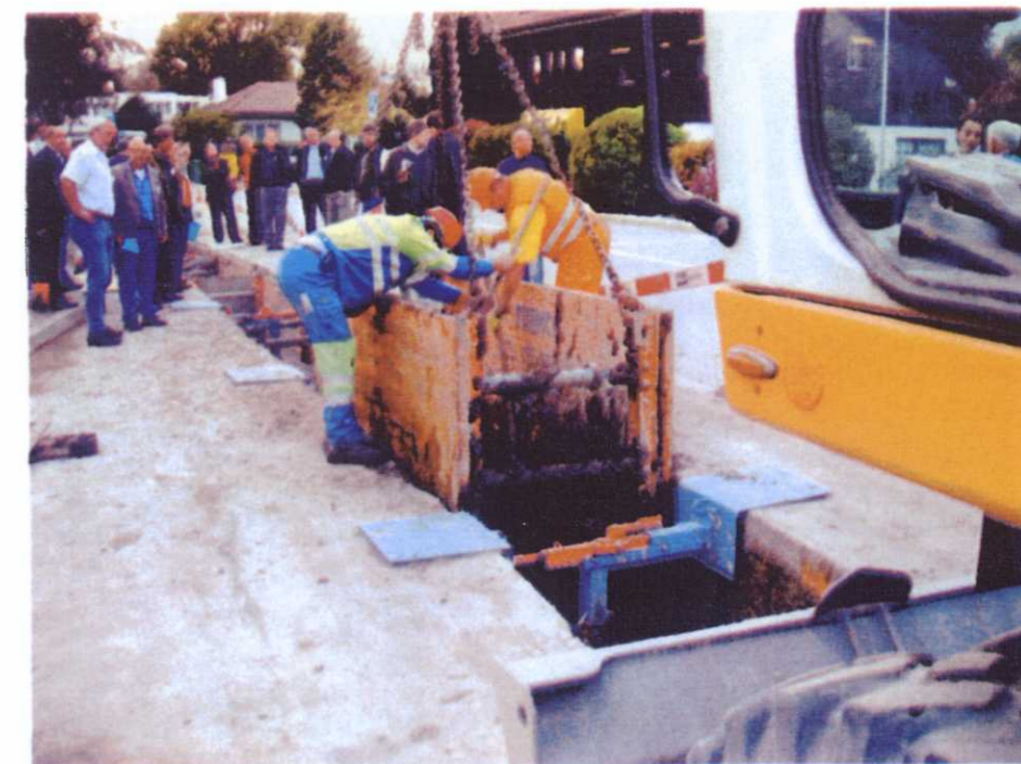
Mise en place du sol fluide sur le chantier de Thielle-Wavre: une démonstration qui en appelle d'autres.

Sur le plan technique, on vient de le voir – le Système RSS-sols-fluides – est une ré-