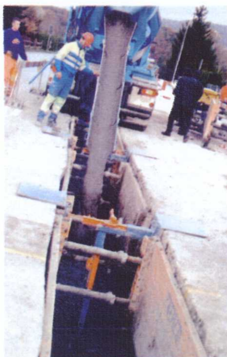
Après le remblayage de la fouille, le sol fluide se solidifie sans qu'aucun compactage ne soit nécessaire.

La révolution dont parle l'ingénieur consiste à combler les fouilles taillées au plus juste dans le sol avec la terre excavée. On l'a dit: cette technique développée en Allemagne est entrée en Suisse par la porte de Neuchâtel. Le bureau d'ingénieur AJS, qui en assume la promotion, a saisi l'occasion qui lui était offerte sur un chantier de Thielle-Wavre pour en démontrer la qualité. Sous les yeux d'une cinquantaine de spécialistes du secteur, des ouvriers du secteur encadrés par deux spécialistes ve-