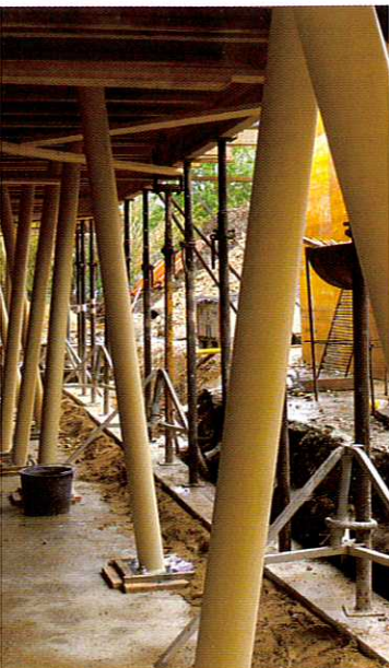
Ligne de piliers posés en biais. Linie mit den schrägen Pfeilern.

Dank des Ausbaus wird das Pflegeheim « Les Sugits » in wenigen Monaten auf zusätzliche Betten zählen können.